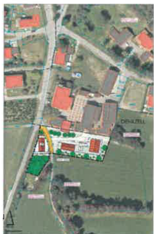
Planauszug Vorentwurf 4. Änderung der Ortsabrundungssatzung Denkzell; Fassung vom 02.11.2022

Das betroffene Gebiet befindet sich am südlichen Ortsrand von Denkzell, direkt an der Gemeindestraße von Denkzell nach Forsting bzw. am Weg zum Buchenwinkel. Um die bauordnungsrechtlichen Voraussetzungen für die Errichtung eines dauerhaften Veranstaltungszeltes sowie von landwirtschaftlichen und gastronomischen Nebengebäuden zu schaffen, soll die bestehende Ortsabrundungssatzung maßvoll erweitert werden.